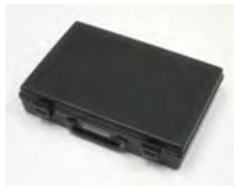
ヒンジ付き樹脂ケース 幅360×奥行270×高さ80mm