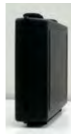
立てても置 けます