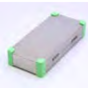
TC-02ハンドル収納ケース