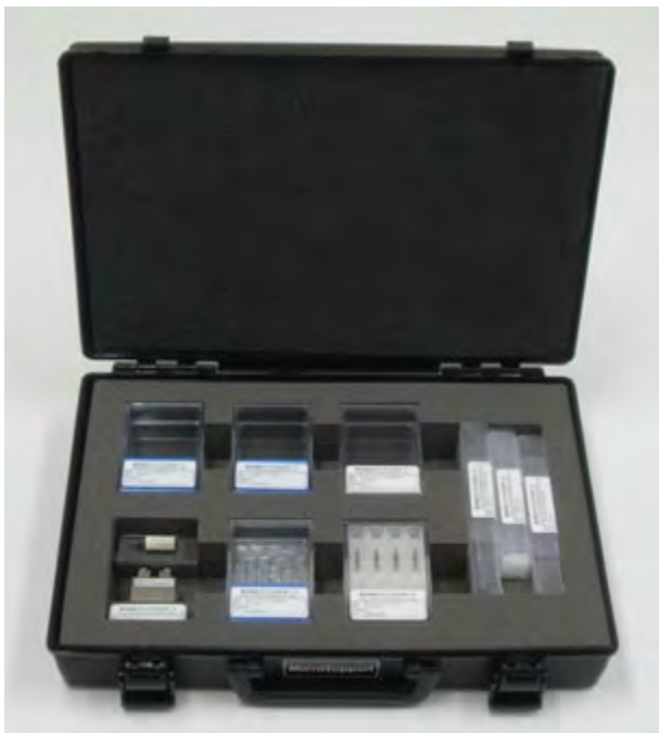
※写真はパッケージ例です※