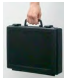
キャリング可能 で安全保管